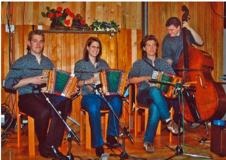
Das Schwyzerörgeli-Quartett Rigigruess – hier bei einem Auftritt an der «Vitznauer-Sennechilbi 2008» – bestreitet jährlich gegen 40 Engagements.

Anstelle der verfrühten Veröffentlichung einer eigenen CD im übersättigten Volksmusikmarkt setzt das Schwyzerörgeli-Quartett Rigigruess momentan viel lieber auf die Möglichkeiten neuer Medien und präsentiert sein musikalisches Gesicht auf der eigenen Internetseite mit einigen ungeschminkten und wirklich authentischen Live-Tonmüsterli. Beim Durchstöbern der ansprechenden und informativen Seiten findet man übrigens auch wertvolle Beiträge über die grossen Vorbilder des Schwyzerörgeli-Quartetts Ri-